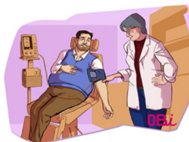
Représentation d'une consultation médicale non stigmatisante auprès d'un patient en obésité