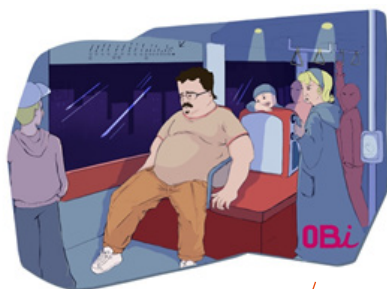
Représentation de l'inadaptation des transports en commun aux personnes en situation d'obésité