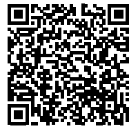
Antiphospholipides, syndrome des / syndrome catastrophique des antiphospholipides (2017)