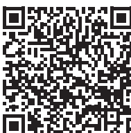
Willebrand, maladie de von (2019)