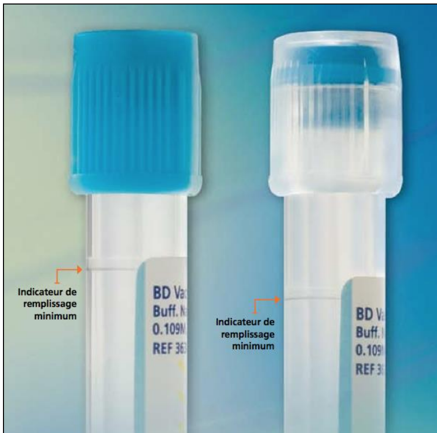
Indicateur de remplissage minimum (90%) pour les tubes citratés utilisés en hémostase = limite d'acceptabilité