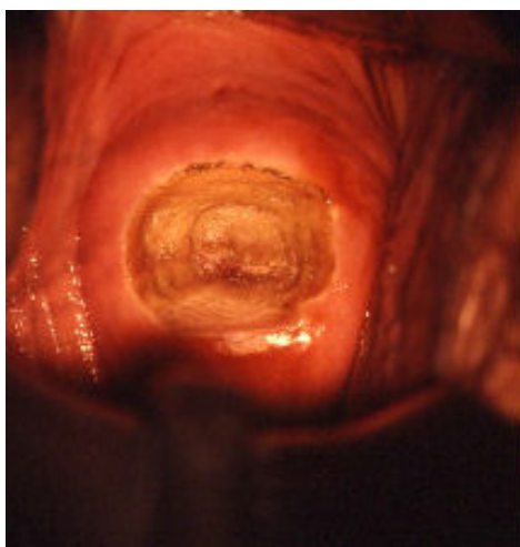
Image du col après conisation