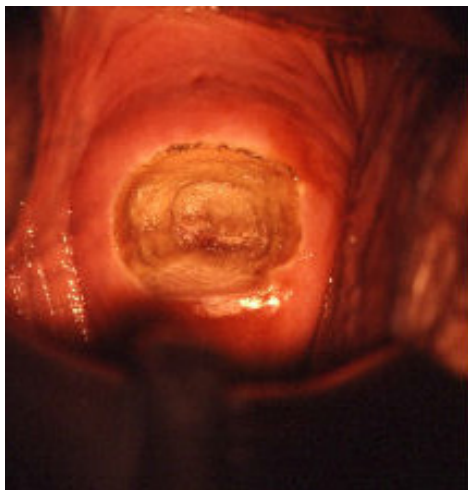
Image du col après conisation